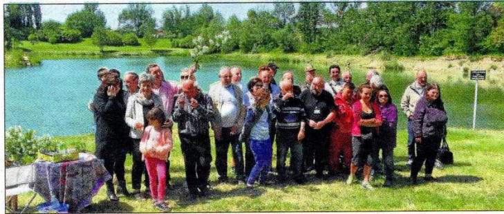
Organisateurs et élus réunis pour la photo de famille

La nouvelle association Génération+, avec ses partenaires Le Cœur au Pied, SHF (Samaritain Handicap France), Husse (aliments pour animaux), Symbiosphère (fabricant de nichoirs en bois pour insectes, oiseaux et petits mammifères) et le Petit Journal, sans oublier les pêcheurs et les Amis du Lac, co-organisateurs, a célébré sa naissance de belle façon ! Plusieurs adhérents de l'association Paméa (qui s'occupe de recueillir et placer des animaux) étaient aussi venus d'Ariège et du Tarn pour cette belle Fête de la Nature au bord de l'eau. Ce fut un moment exceptionnel de convivialité autour d'un excellent repas préparé dès l'aube par les pêcheurs et les Amis du Lac. A cette occasion, Génération+ a présenté