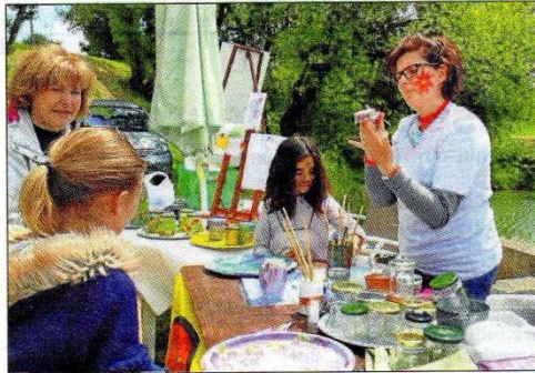
Gros succès pour l'atelier maquillage